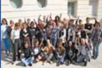
L'équipe des bénévoles