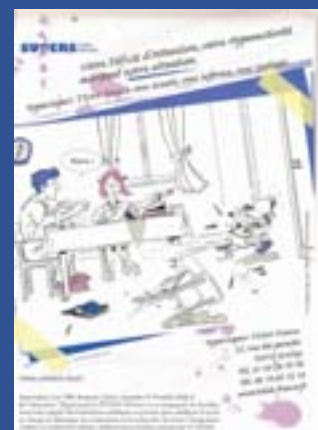
Illustration Pascal Maréchal www.lagonrouge.com

L'affiche de l'association est disponible sur simple demande en format A4 pour les cabinets de consultation, les écoles, et en format A3 pour les hôpitaux et les centres de soins.